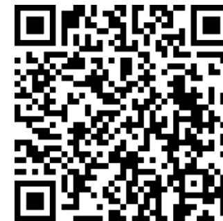
Индивидуальный перечень форм для респондентов