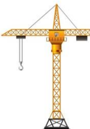
Физический объем работ (по сравнению с 1 кварталом 2023 года)