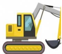
Видовая структура направлений деятельности строительных организаций