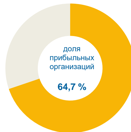
Доля организаций, получивших прибыль