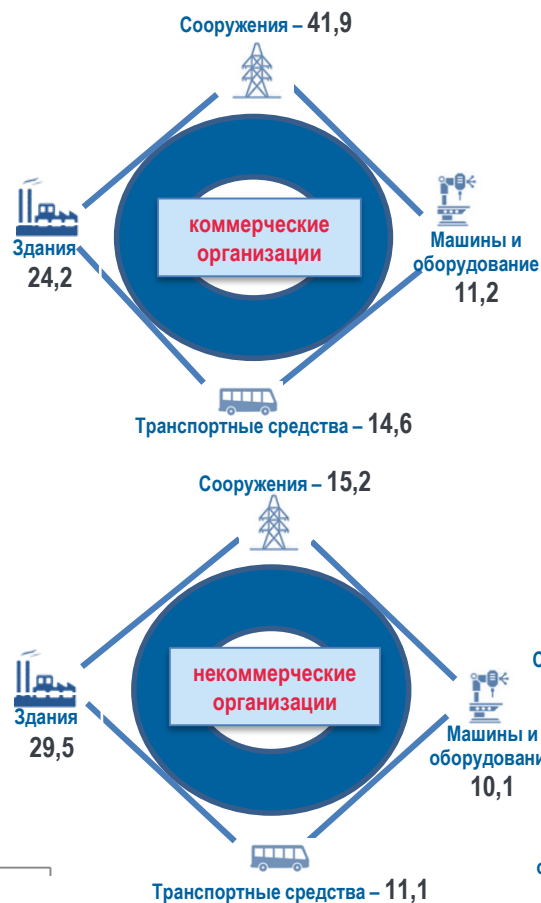
ВОЗРАСТНАЯ СТРУКТУРА ОСНОВНЫХ ФОНДОВ (средний возраст на конец года, лет)