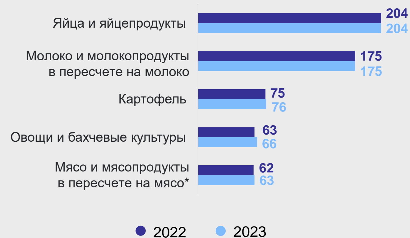
ПОТРЕБЛЕНИЕ НА ДУШУ НАСЕЛЕНИЯ В ГОД килограмм