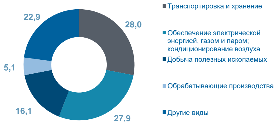
Наибольший удельный вес видов экономической деятельности в общем объеме инвестиций, %