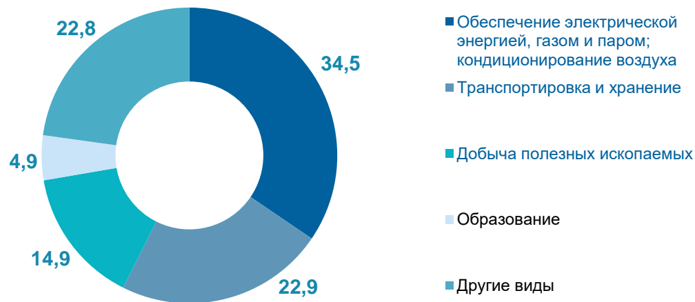
Наибольший удельный вес видов экономической деятельности в общем объеме инвестиций, %