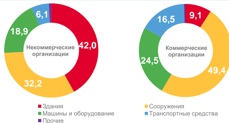
Видовая структура основных фондов на конец года, в процентах