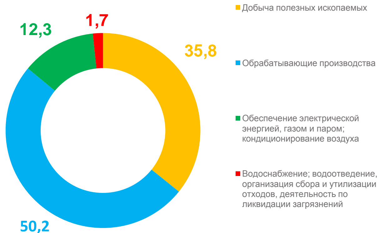
Структура объема отгруженных товаров собственного производства в январе – сентябре 2022 года, в %

Водоснабжение; водоотведение, организация сбора и утилизации отходов, деятельность по ликвидации загрязнений