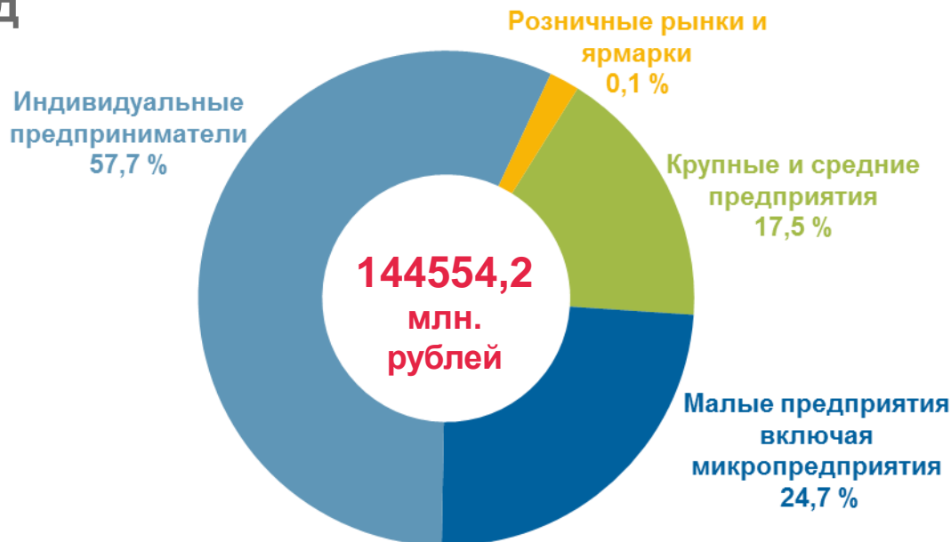
Структура оборота розничной торговли по хозяйствующим субъектам (в процентах) в январе-июле 2022 года