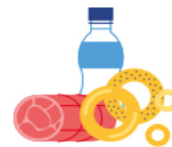
Товарная структура оборота розничной торговли в январе-июле 2022 года