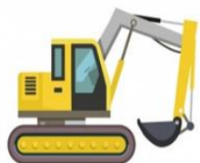
Видовая структура направлений деятельности строительных организаций